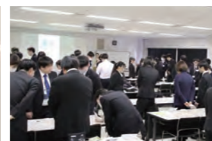
かるたによる体験型学習