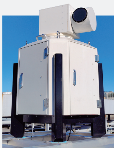
風況観測中のドップラー・ライダー (2025年6月末まで当社屋上に試験実施)